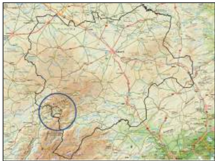
Localización del municipio en provincia de Albacete