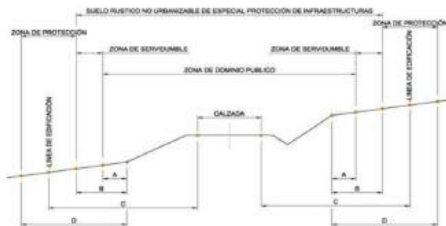
Definición de las Zonas de Afección y Suelo Rustico No Urbanizable de Especial Protección de Infraestructuras de las carreteras CM-3204 y CM-3205 existentes en el término municipal de Villaverde de Guadalimar

En el caso de variantes de población el espacio comprendido entre la línea de edificación y la calzada tendrá la consideración de suelo no urbanizable en el que, en ningún caso, podrán ubicarse edificios o instalaciones.